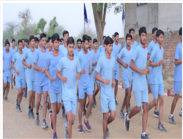
Well Equiped Ground