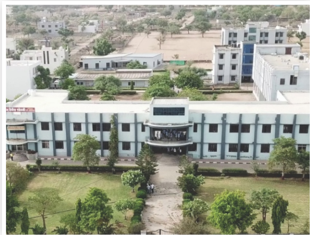
Lush Green Campus