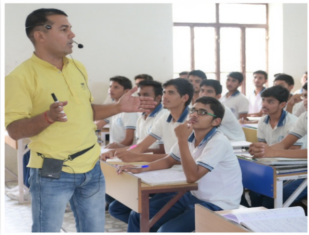
Well Furnished Class Room