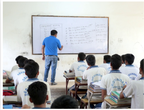
Well Qualified Faculty Team