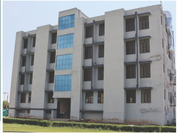
Centrally Aircooled Hostel